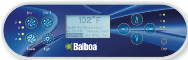
Pannello di comando con fili MLM990S