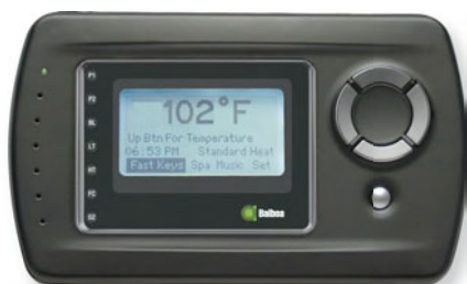
Comando wireless MLM990H